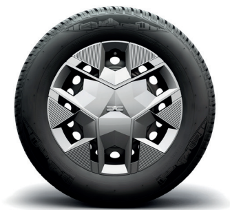
14-Zoll-Stahlräder mit Radvollblende CIANS