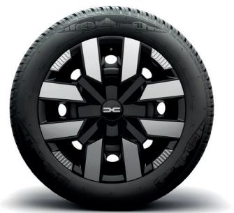
15-Zoll-Stahlräder mit Radvollblende RESIA