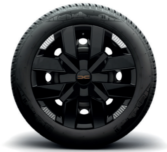
15-Zoll-Stahlräder mit Radvollblende DANUBE